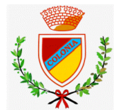
TABELLA ESTIVA PASTI TRASPORTATI PER IL COMUNE DI COLOGNE (SECONDARIA) - A.S. 2023-2024