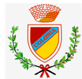
TABELLA INVERNALE PASTI TRASPORTATI PER IL COMUNE DI COLOGNE (SECONDARIA) - A.S. 2023-2024